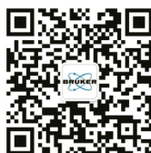
布鲁克磁共振微信公众号